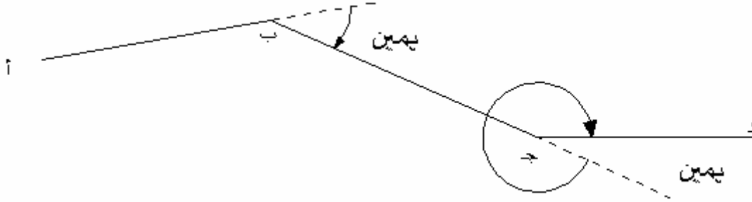
الشكل ٧,٤: زاوية نحو اليمين

هي الزاوية بين الخط الذي يسبق النقطة المقاس عندها الزاوية و الخط الذي يتبع هذه النقطة على أن تقاس الزاوية هذه دائماً باتجاه عقرب الساعة (الشكل ٧,٤).